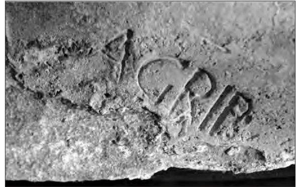
Sello AGRIP en el lateral del lingote de Cap d'en Font.

Si al probable origen hispano de los lingotes de Comacchio, sumamos el dato que proporciona el lingote menorquín, el panorama se nos presenta muy sugerente, y refuerza la posibilidad de una implicación personal de Agripa en el negocio