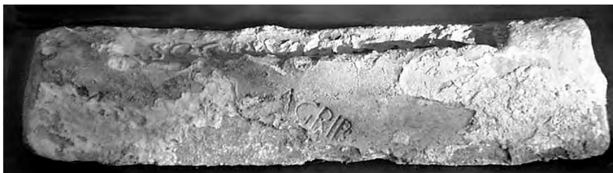
Lingote de plomo del pecio de Cap d'en Font (Sant Lluís, Menorca) (Foto J.C. de Nicolás).

La tipología coincide con el tipo I de Cl. Domergue 1 , con un paralelo en cuanto a la forma y paleografía con los lingotes de M. Raius Rufus que corresponden también a la época augustea 2 .